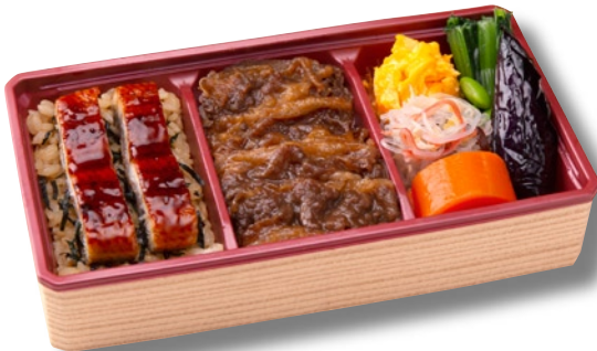
柿安ダイニング「黒毛和牛 牛めし&うなぎ弁当」1,380円 うなぎの蒲焼と柿安の看板商品である黒毛和牛を使用した「牛めし」に、5種類のおかずを盛り込んだ弁当。