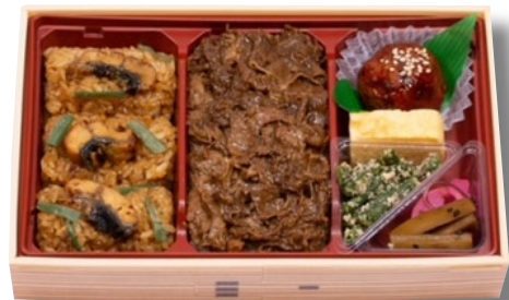
おこわ米八「鰻おこわとすき焼きのスタミナ弁当」1,259円 うなぎおこわと、白蒸しおこわの上にすき焼きをトッピング。たくさん食べたい方におすすめの一品。