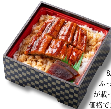
まねき「うな重」1,350円 ※7/24限定20個、8/5限定10個 ふっくら肉厚なうなぎが載ったうな重を手頃な価格で食べられる。