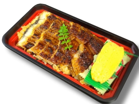
魚くみ 「国産うなぎ蒲焼丼」1,620円 国産うなぎをたっぷり使用。タレ混ぜご飯でどうぞ!