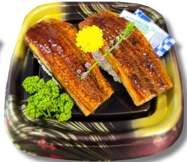
魚くみ「デカネタうなぎ寿司」 相性バツグン！名物デカネタのうなぎ寿司。