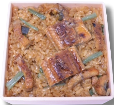
おこわ米八「鰻おこわとすき焼きのスタミナ弁当」1,259円 うなぎおこわと、白蒸しおこわの上にすき焼きをトッピング。たくさん食べたい方におすすめ。