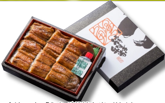
近江今津 西友「うなぎ蒲焼弁当 (特上)」5,184円 香ばしさと旨みが自慢のうなぎ蒲焼を贅沢に丸々一尾使用した弁当。