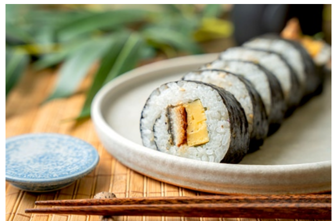
むろや別邸「うな玉巻き」1,296円 ※販売期間：7/24（水）～8/5（月） 香ばしさと旨みが自慢のうなぎと玉子の相性が間違いなしの巻き寿司。