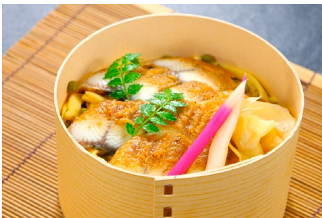
すし萬「鰻ちらし」3,240円 ※各日限定10個 ※販売期間：7/23、24 国産のうなぎとしっかりとてふわふわな食感が特徴の錦糸玉子を使用したすし萬独自のちらし寿司。