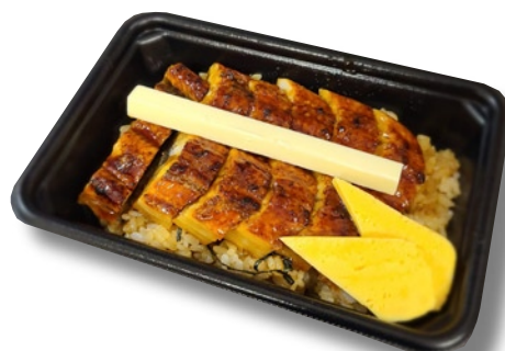
魚くみ 「うなぎバター丼」1,187円 ふっくらうなぎとやみつきバターで相性バツグンの丼。