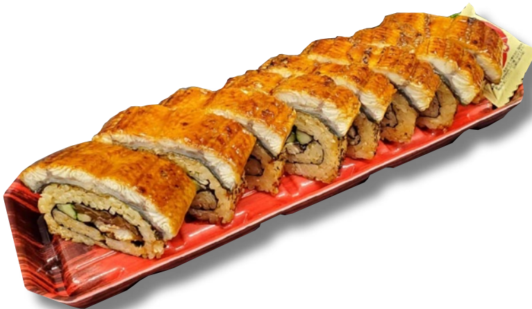
魚くみ「魚くみ特製うなぎ棒寿司」2,590円 1本1本丁寧に作るボリューム満点の巨大棒寿司。

2024年7月24日（水）、8月5日（月）は土用の丑の日。今年も観測史上“最も暑い夏”を更新すると 2の予想が発表された。そんな猛暑を乗り切るべく、大丸松坂屋百貨店の大丸心齋橋店では7月17日（水） から、同店本館地下1階食品売場と地下2階フードホールにてスタミナメニューを展開する。