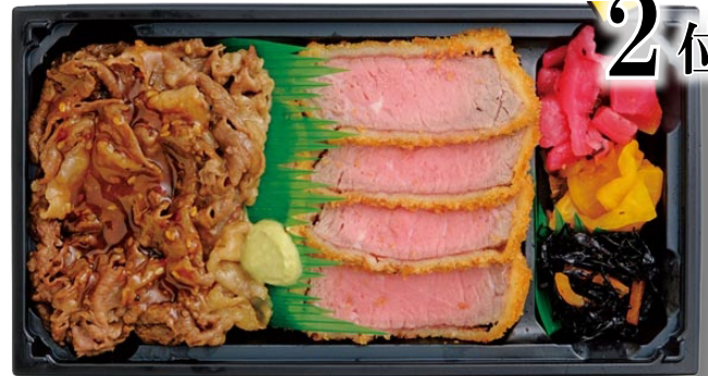
〈黒毛家〉「牛カツと黒毛和牛カルビのミックス弁当」