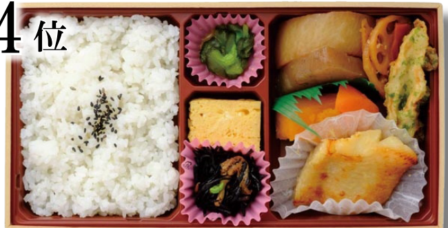
〈まつおか〉「カラスカレイ味噌漬焼弁当」1,134円

まつおかで人気の「カラスカレイ味噌漬焼」を使用した弁当。骨の無いやわらかなカラスカレイを堪能できる。