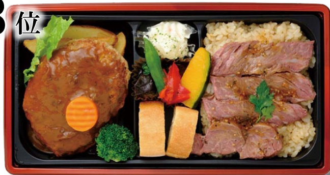
〈eashion〉「デミグラスハンバーグ&牛サガリのガーリックライス御膳」1,190円

“牛サガリ”を使用し、ガーリックライスと黒胡椒を効かせたソースが一押し。トマトと赤ワインの酸味が特徴のソースでハンバーグと合わせたスペシャルな洋食御膳。