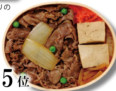
〈浅草今半〉「牛肉弁当」1,296円